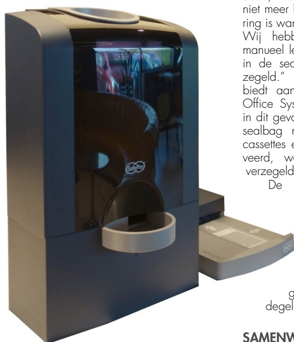
Het SafePay Front Office Systeem is verkrijgbaar als lage en hoge muntenmodule. Daarnaast kan de machine in elke gewenste kleur worden geleverd

info.be@fichetgroup.com www.fichetgroup.be